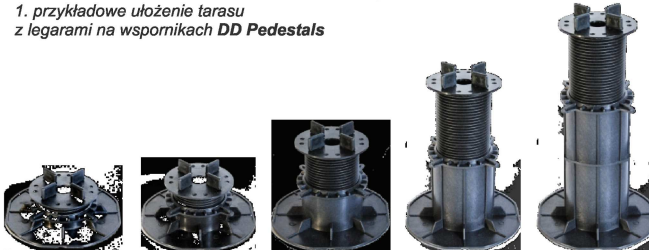
DDP 30-45 mm DDP 45-70 mm DDP 70-120 mm DDP 120-220 mm DDP 220+DS

SALES OFFICE/Dział Sprzedaży tel. 058-511-04-31 sales@ddpedestals.eu